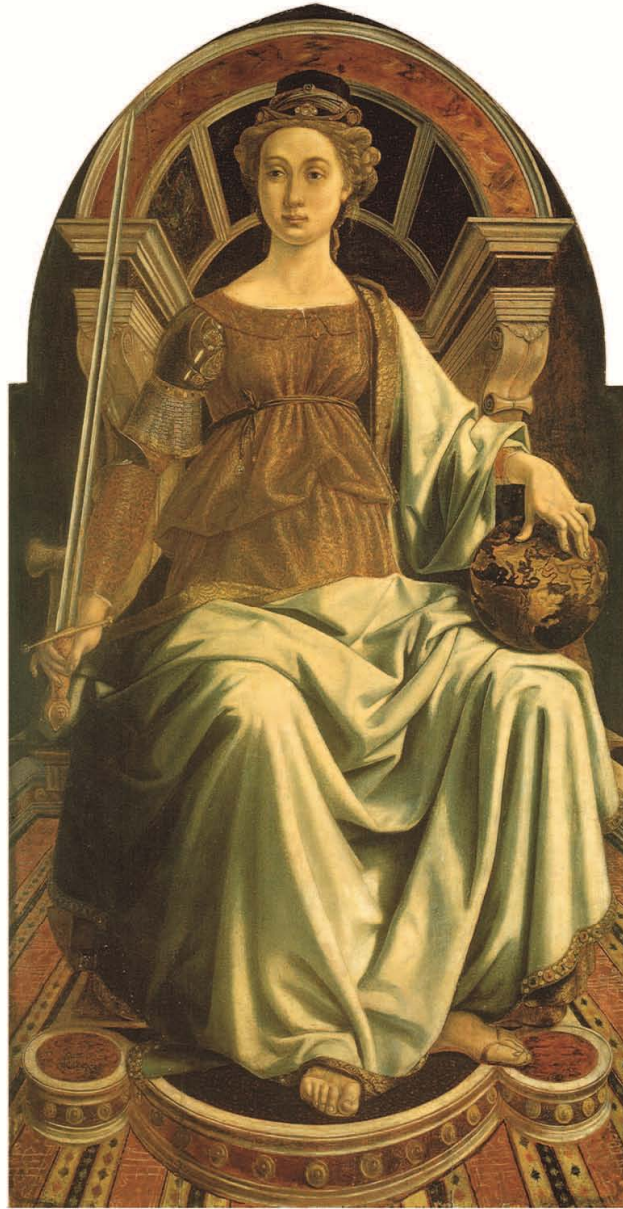
Piero del Pollaiuolo, La Giustizia , olio su tavola (1470), Firenze, Galleria degli Uffizi