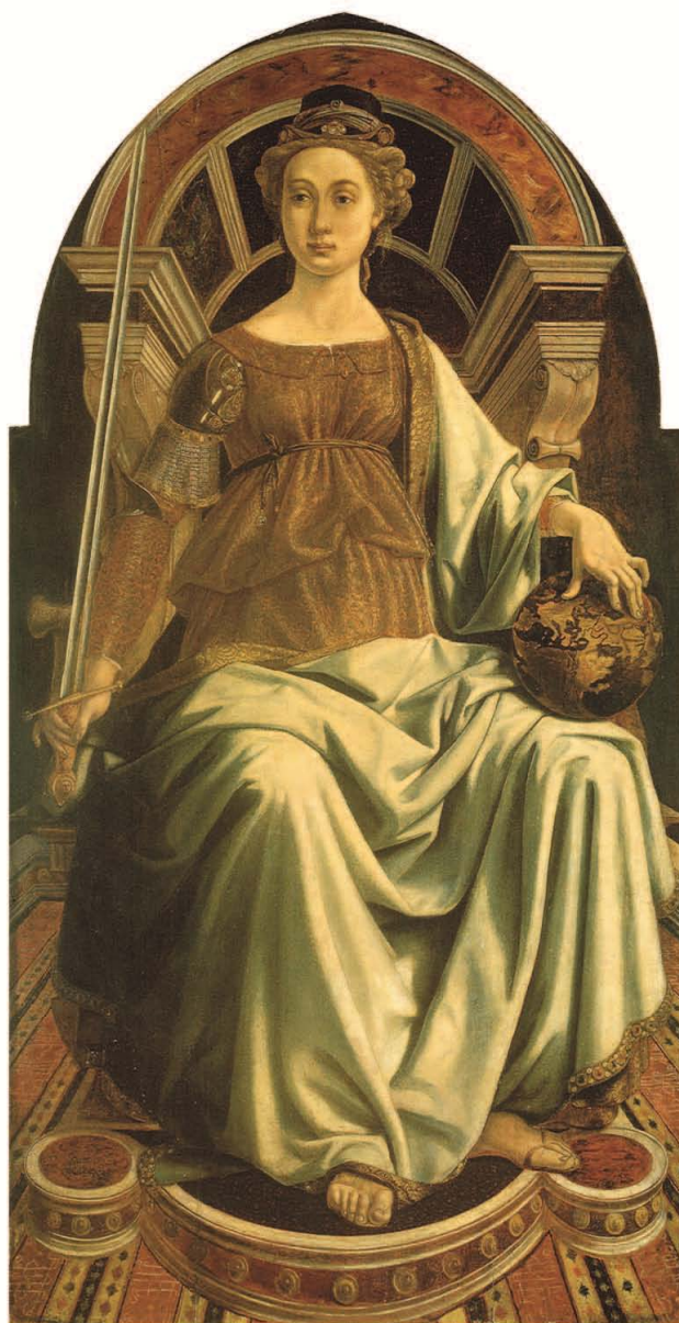
Piero del Pollaiuolo, La Giustizia , olio su tavola (1470), Firenze, Galleria degli Uffizi